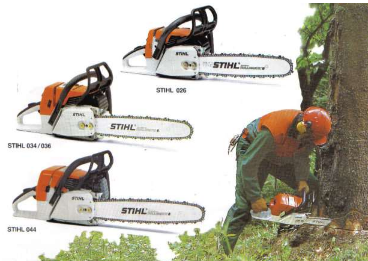
Рис. Бензомоторные профессиональные пилы «Stihl 026», «Stihl 036», «Stihl 044»