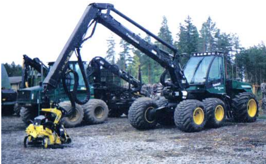
Рис. 30 Харвестер Ponsse, на заднем плане форвардер этой же фирмы.

Применяются в лесной промышленности уже достаточно давно. Развитие получили харвестеры зарубежного производства, которые мало применялись в России. Харвестеры имеют гидроманипулятор и харвестерную головку, осуществляющую срезание дерева, очистку ствола от сучьев и раскряжевку на сортименты, причем место раскряжевки устанавливает компьютер. Он же определяет объем заготовленной древесины с распределением по категориям технической годности, категориям крупности древесины и сортам. Протаскивание ствола через харвестерную головку осуществляется с помощью смонтированных в ней зажимающих валцов или гусеничного подающего устройства. Все операции с одним деревом занимают несколько секунд.