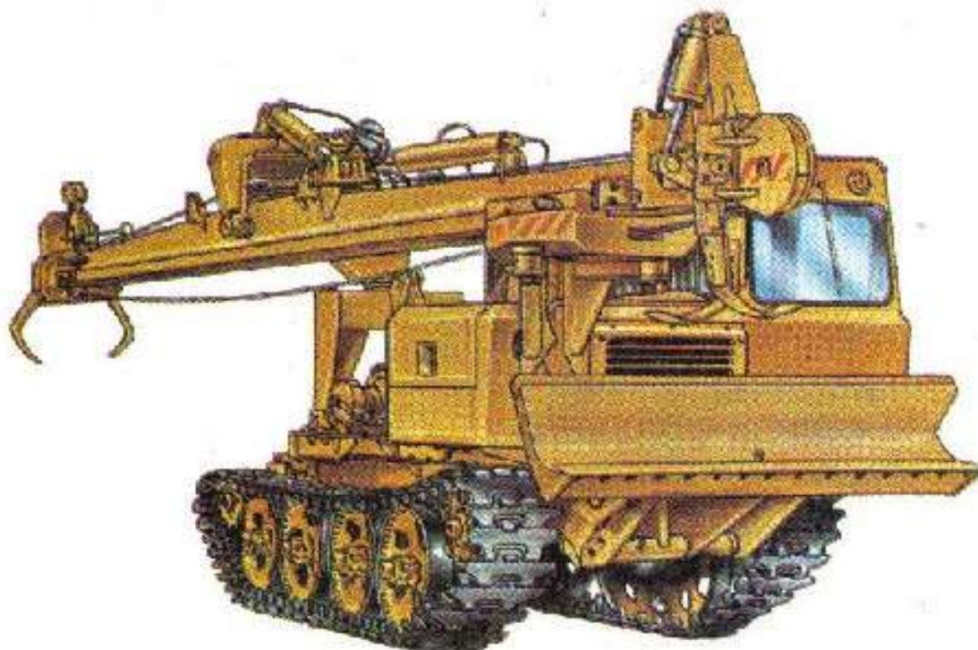
Рис. Самоходная сучкорезная машина ЛП-30.

сучкорезной головки конце стрелы имеется приемная головка, V-образные ножи которой производят доочистку сучьев. Стрела в 2 – 3 раза короче дерева, поэтому приемная головка поддерживает дерево, пока зажим возвращается к сучкорезной головке для следующего приема протаскивания. После завершения протаскивания дерева сквозь сучкорезную головку захват раскрывается, и хлыст падает на землю. Обрезанные сучья, по мере их накопления, машина сталкивает в сторону толкателем, или эту работу выполняет пачкоподборщик, например, ЛТ-154 А.