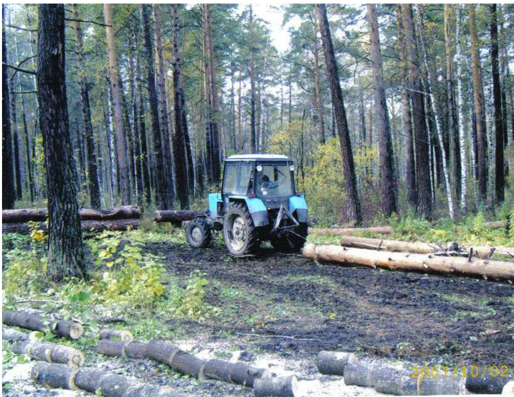
Рис. 22 Сельскохозяйственный трактор МТЗ 82-1 в процессе трелевки сортиментов на погрузочном пункте

Лесоматериалы прицепляют к навеске трактора с помощью чокеров – коротких (длиной около 1.7 – 3.5 м) стальных тросов, у которых оба конца заплетены в виде петель, а между ними по тросу свободно перемещается стальной крюк.