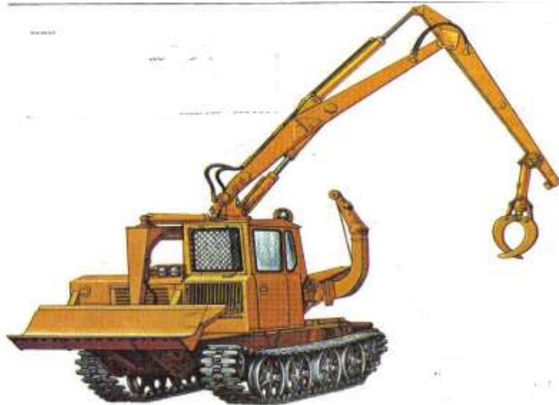
Рис. Трелевочный трактор с бесчokerным оборудованием ТБ-1.

Бесчokerные трелевочные тракторы часто используются как подборщики пачек деревьев, сформированных на волоке валочно-пакетирующими машинами.