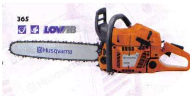
Рис. Бензомоторная профессиональная пила «Husqvarna-365»

Пилы «Stihl» (рис. 16) имеют антивибрационную систему AV, электронную систему