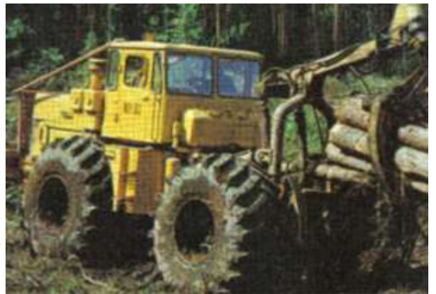
Рис. Подборщик пачек ЛТ-157.