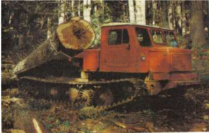
Рис. Трелевочные тракторы с чокерным оборудованием ТДТ-55 и ТТ-4М

Трактор заезжает по волоку в пасеку и разворачивается к погрузочному пункту. Затем он опускает щит на землю под углом к ней и к раме трактора. Чокеровщик вытаскивает трос за кольцо к сваленным деревьям или к иным лесоматериалам, и зацепляет чокерами сразу столько, сколько нужно на один рейс. Тракторист запускает лебедку, и лесоматериалы волоком перемещаются к трактору, по ходу движения формируясь в пачку, и надвигаются комлями на щит. Пачка фиксируется, щит поднимается и ложится на раму, трактор начинает движение к погрузочному пункту с пачкой лесоматериалов. На труднопроходимых участках волока тракторист может сбросить пачку, не отцепляя ее от тягового троса, и, преодолев участок без груза, подтащить ее лебедкой, и снова загрузить на щит. При разгрузке на погрузочном пункте пачка расфиксируется и сваливается со щита, рабочий отцепляет чокера, и трактор идет обратно в пасеку.